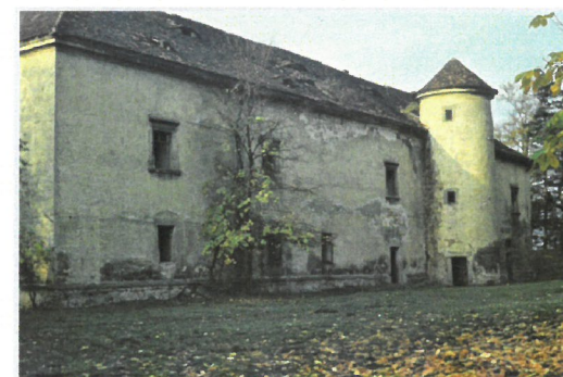
Zámek, rok 1975