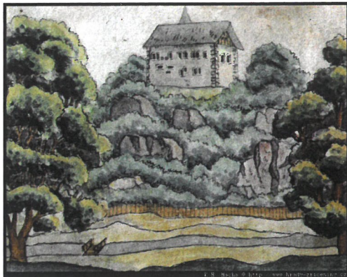
K.H. Mácha - perokresba inkoustem a akvarel, asi r.1833